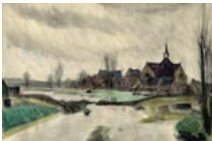
Graafwerkzaamheden aan de Mark bij Verlaatbrug, met zicht op de kerk bij de Oranjeboomstraat, 1947