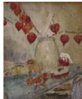
Stillevens, gemengde techniek, 1949