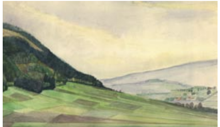
Gezicht op Ravensteinberg, Ullersdorf, 1944

Gaan we vandaag weg? De stier is op, maar [er is] nog eten genoeg. Weer zeer mooi weer. [Ik heb] 24 sigaretten geruild voor een tekendoos. We wachten maar. Vanmiddag geen warm eten. Vier pond brood en [een] _ pond brood en vet gedeeld. Vijf paarden hebben de jongens verkocht voor 8000 M.