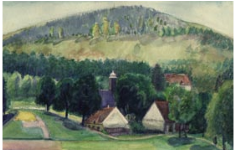
Gezicht op Ullersdorf, 1944