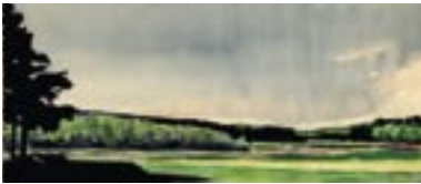
Uitlopers van de Eifel, Ruhrgebied

Catalogus bij de tentoonstelling in Zorgcentrum Oranjehaave, Locatie Lucia, Liesboslaan 6 Breda, van 28 februari tot 31 mei 2004.