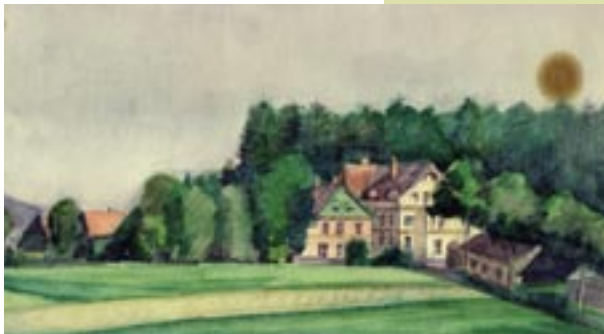
Gezicht op Grunewald, 1944