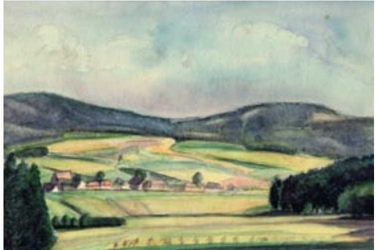
Gezicht op Schomberg, 1944