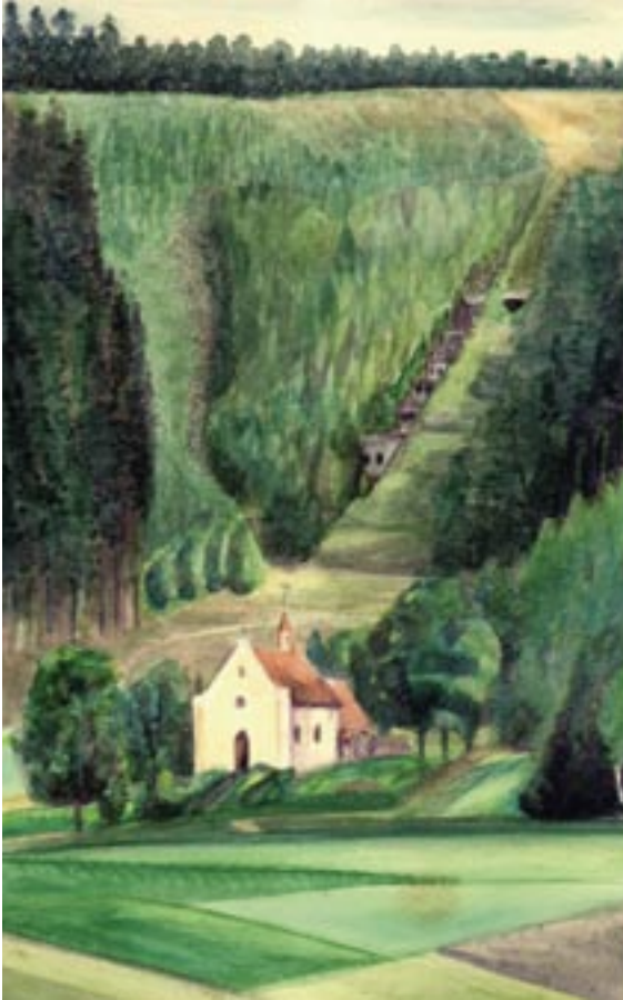
Gezicht op de springschans Ullersdorf met kapel, 1944