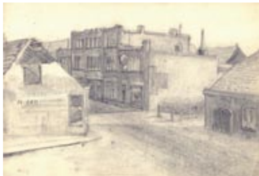
Uitzicht (links en rechts) gezien vanuit het ouderlijke huis aan de Teteringsedijk. Tekening uit schetsboek, rond 1948