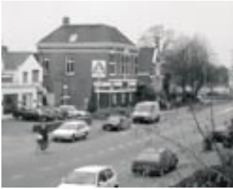
Huidige situatie, 2004