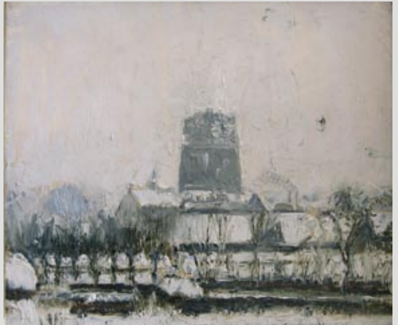
De Dom van Oosterhout