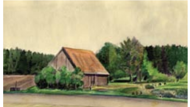
Schuur in de buurt van Regensburg, 1945