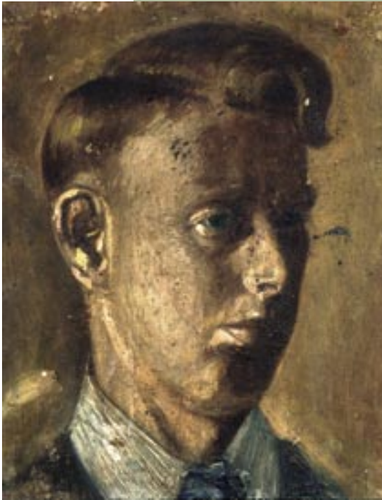
Zelfportret, olieverf 1935