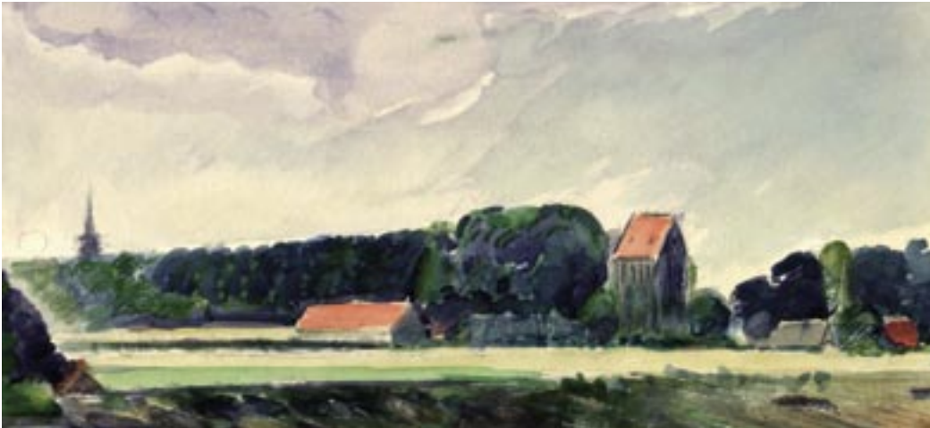
Gezicht op de kerk van Overakker met in de verte de kerk van het Ginneken