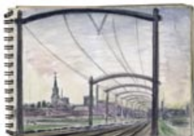
Spoorlijn achter de Teteringse Dijk