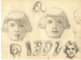
Studies uit een van de schetsboeken

De uit Engeland overgewaaiden ideeën van de Arts and Crafts-beweging 2 die grote invloed hadden op de ‘vaderlandsche architectuur’, zullen daar niet vreemd aan zijn geweest. Ambachtelijke technieken met een artistiek gehalte zouden gedurende het Interbellum van hun oorspronkelijke beroepsgroepen vervreemden om voortaan exclusief aan kunstacademies gedoceerd te worden.