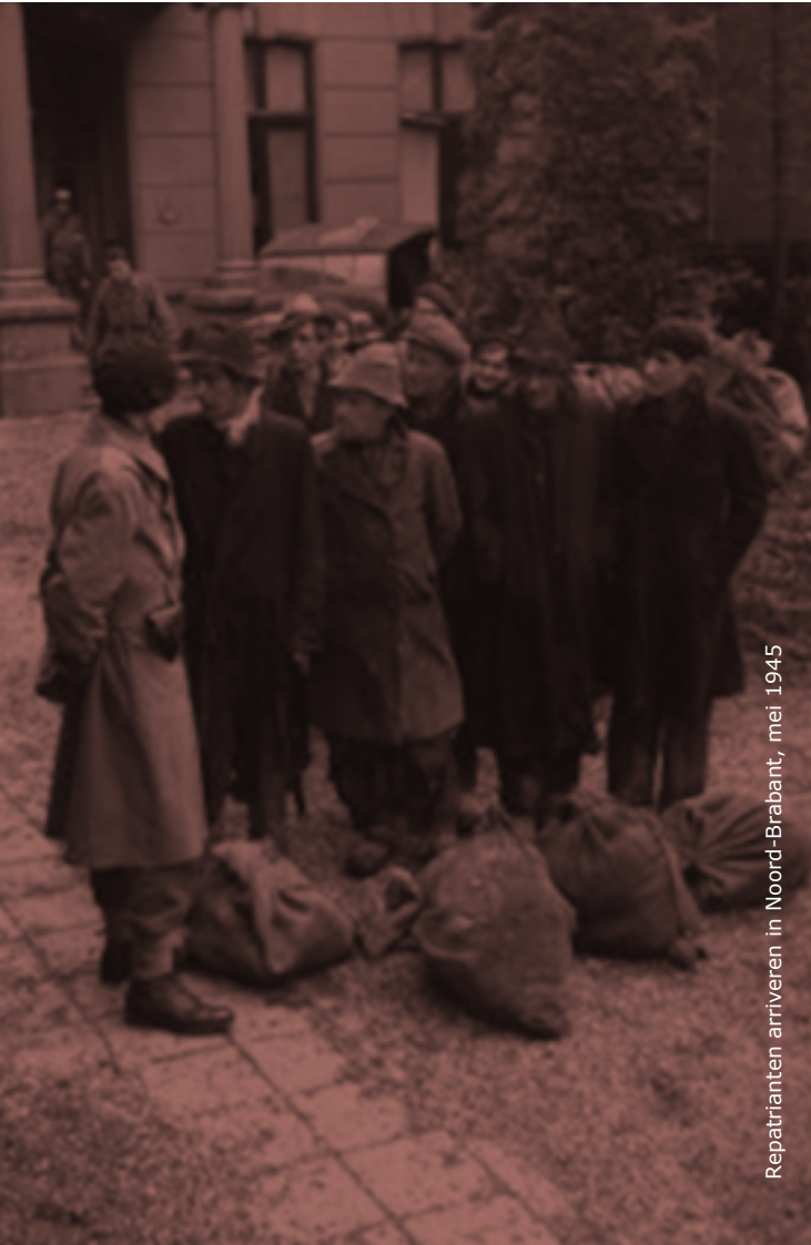
Repatrianten arriveren in Noord-Brabant, mei 1945